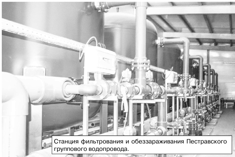
Станция фильтрации и обеззараживания Пестравского группового водопровода.

гами. В районе развита сеть предприятий торговли, общественного питания и бытового обслуживания. 142 предприятия торговли, общая площадь которых составляет 10243 кв. м, предприятий общественного питания различных форматов: открытой сети - 8 (посадочных мест - 560), 11 столовых при учебных заведениях с количеством посадочных мест 698. На сегодняшний день ассортимент реализуемых товаров удовлетворяет практически все потребности покупателей. Существенно из-