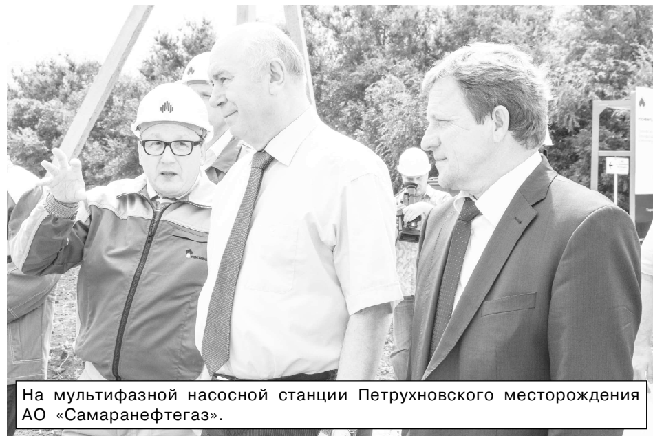
На мультифазной насосной станции Петрухновского месторождения АО «Самаранефтегаз».

при первом взгляде на корову понять, что с ней не так и что нужно сделать. Так же и с механизаторами. Ни один руководитель не посадит тракториста, не имеющего специальную подготовку, за штурвал нового комбайна или трактора, стоимость которых сегодня до 15 млн рублей. Кадры стареют, их нужно будет кем-нибудь заменять. А вот кем - вопрос. Не бежит молодежь в поле трудиться. Этим вопросом также озабочено министерство сельского хозяйства и продовольствия Самарской области.