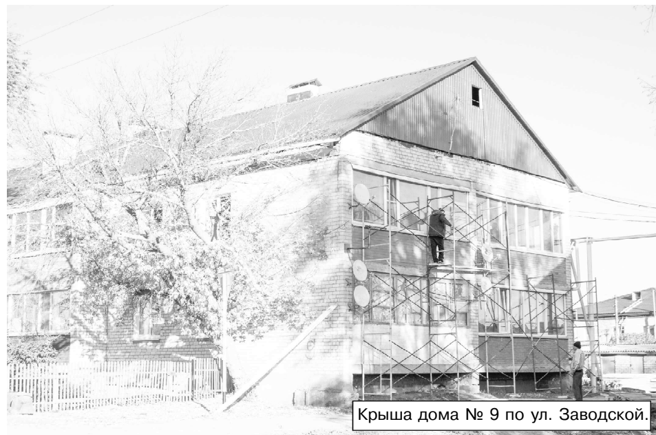
Крыша дома № 9 по ул. Заводской.

годы» ведётся строительство Пестравского группового водопровода, который обеспечит население сёл Пестровка, Майское, Михайло-Овсянка, посёлков Овсянка и Михеевка чистой водопроводной водой. Кроме того, в таких сёлах, как Красная Поляна, Идак-